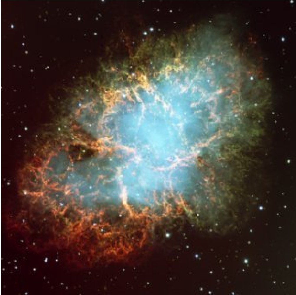
Nébuleuse du Crabe

Le rouge, le vert et le jaune/orange sont les couleurs principales que l'on trouve dans les nébuleuses.